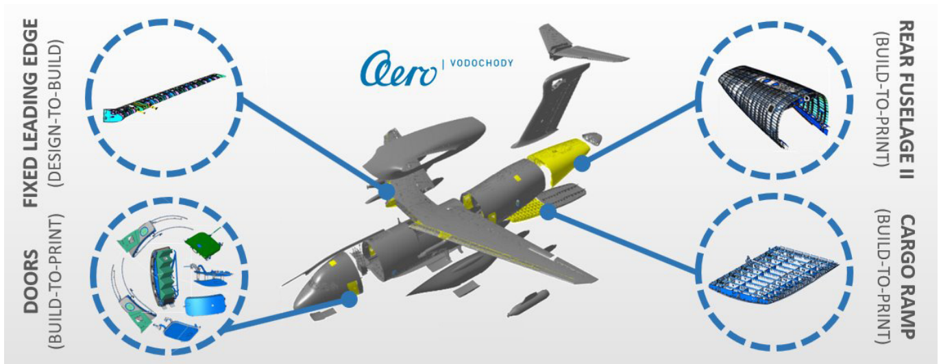
Obrázek 1: Komponenty produktu C-390.